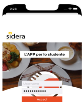
(schermata di accesso)

4) A conferma della prenotazione, il calendario presenterà la giornata di interesse con bollino arancione; cliccare sulla giornata di prenotazione per visualizzare il QrCode valido solo per quella prenotazione ( non utilizzabile più volte ) e che identifica in maniera univoca l'utente e la selezione (giorno e luogo) effettuata. Si vedano le immagini di seguito.