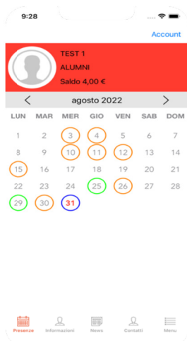
(calendario mensile per prenotazione pasto)